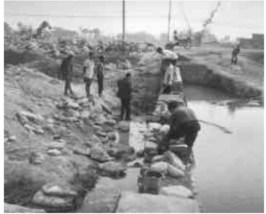
मुडे खोला सिंचाई योजना, हाँसपोसा-८

मुडे खोला सिंचाई योजना एउटा स्थानीय उपभोक्ता र आरआरएनको संयुक्त प्रयासको नमुना योजना बनेको छ । यस योजना अन्तर्गत जम्मा १०७ घर धुरी मध्ये विभिन्न तराई तथा पहाडी जात जातिका ६४ घर धुरीका जम्मा ३११ जना पुरुष र २८६ जना महिलाहरू लाभान्वित भएका छन् । अत्यन्तै गरिब ३९ घर परिवारका २४६ जनसंख्याले अन्य जग्गा धनीको भूमिमा खेती गरि आश्रित हुनु पर्ने अवस्थामा उक्त सामुदायिक सिंचाई कार्यक्रमले अब धानबाली लगाउन पनि