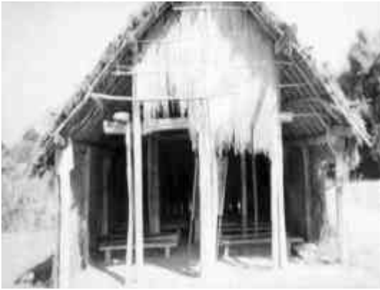
रात्रि प्रा.वि.को पहिलाको अवस्था