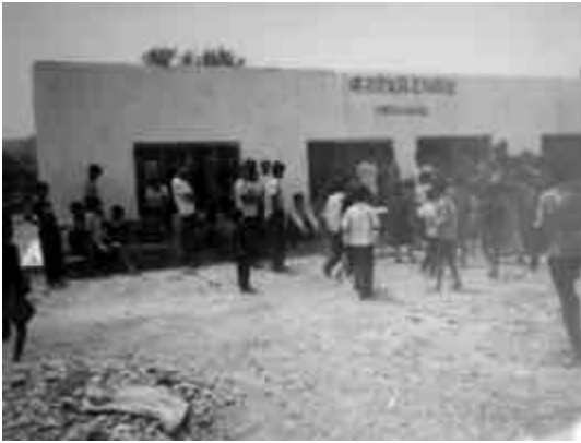
आरआरएनको सहयोगमा निर्माण गरिएपछि विद्यालयको अवस्था, दाङ

रात्रि प्राथमिक विद्यालय, गोवर्द्धिया गाविस वार्ड नं-४ पचाहाको स्थापना २०३५ सालमा भएको थियो । मध्यपश्चिमाञ्चल दाङ जिल्ला, राप्ति नदीको दक्षिण भेगमा पर्ने यस विद्यालय थारु