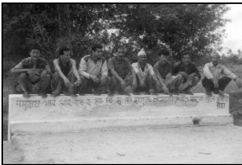
अलायो डाँडा कल्भर्ट, तोपगाछी, आरआरएन, कृपा

कल्भर्ट: यस अन्तर्गत दमक, घैलाडुब्बा, कोहवरा, लखनपुर, सतासीधाम र तोपगाछीका अति विकट स्थानहरूमा ६ वटा कल्भर्ट निर्माण तथा मर्मत सम्भार गरि ७०६८ घरधुरीका ३८,८४७ जना लाभान्वित भएका छन् । उक्त योजनाहरूको कुल अनुमानित लागत रु २३,८१,५८३.३५ मध्ये